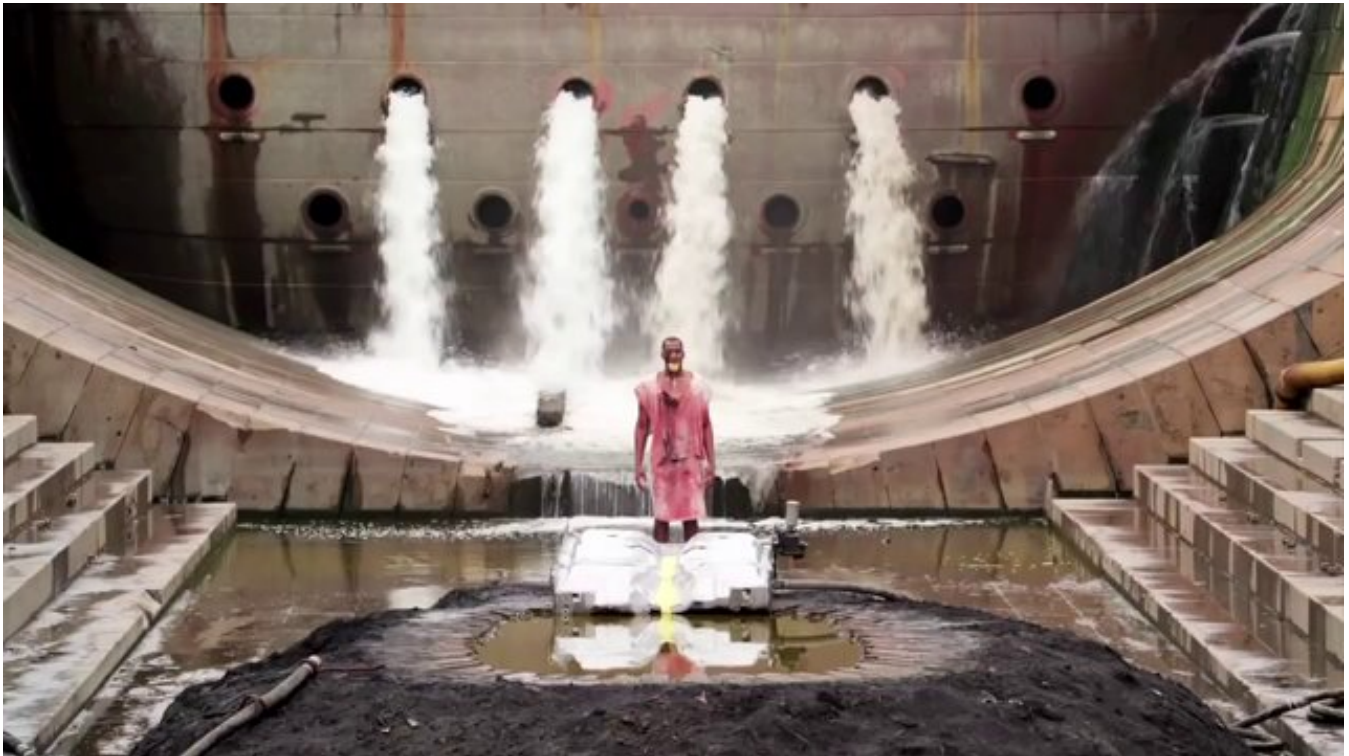
The river of fundament- Matthew Barney