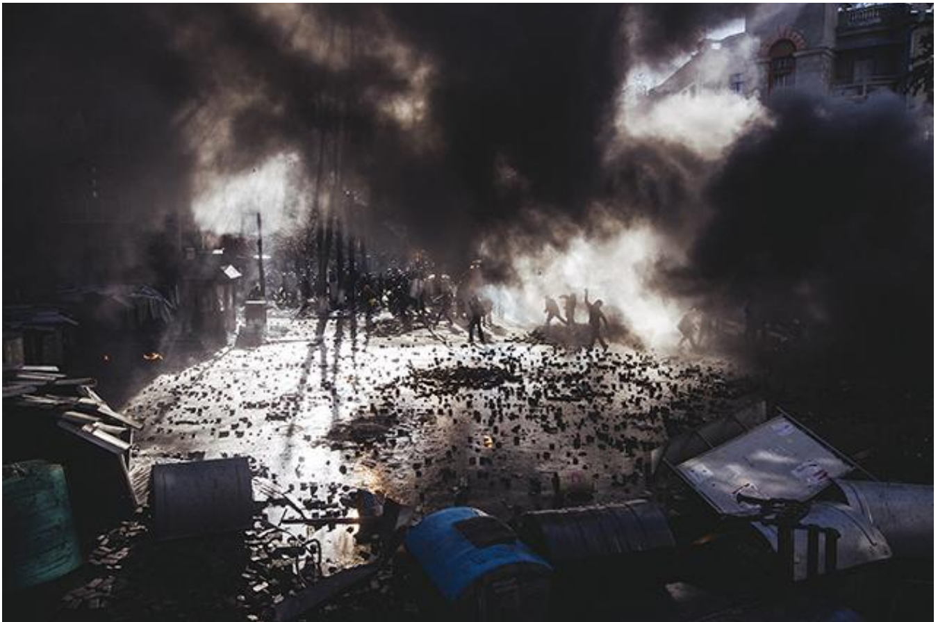
Maïdan, Kiev