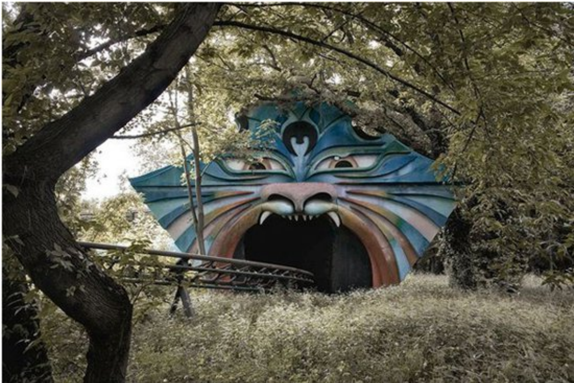
Parc d'attraction désaffecté

Création Avril 2015 THEATRE MUSICAL KIEV- UKRAINE