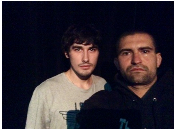
Créon et Hémon